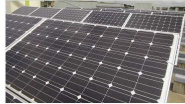
上下水道局睦浄水場の太陽光発電パネル

※節電・「自然エネルギー活用」型建築。その他にも自然採光、自然通風、高効率設備機器を採用。